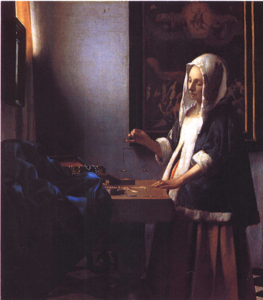
Johannes Vermeer, Woman Holding a Balance , ca. 1665, 42x35.5cm, National Gallery of Art, Washington(D.C.)

三、17 世紀的荷蘭是當時世界的海上強權，當代藝術史學家和歷史學家透過對 Johannes Vermeer (約翰尼斯·維梅爾, 1632-1675) 畫作的分析，以多元視角獲得了豐碩成果。請嘗試分析下圖維梅爾《持秤婦人》作品的創作手法(構圖、形式)與意涵(例如 17 世紀的海貿、宗教或社會價值觀等)。(25%)